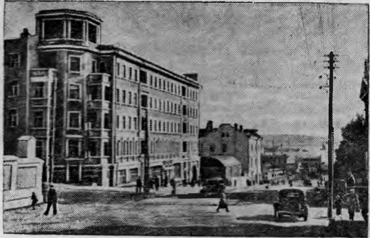
Китайская улица в городе Владивостоке.